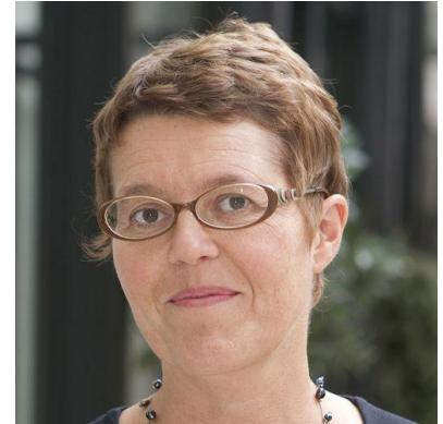
Bénédicte Sanson, pionnière du mentorat en France